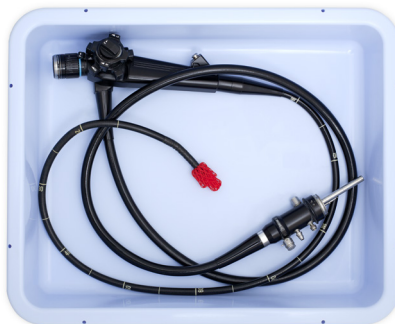
TP-100-03 Distalschutz in Anwendung mit Endoskop und 103614A-P Transportwanne